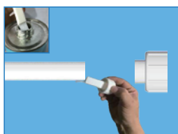
B: 塗上黏著劑將量測管與法蘭接合