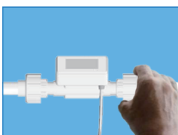
C: 將法蘭與流量計旋緊並送電